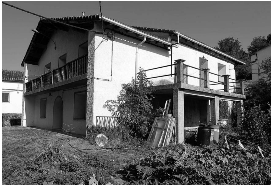
La casa parroquial de Olague ha sido acondicionada como albergue de peregrinos.