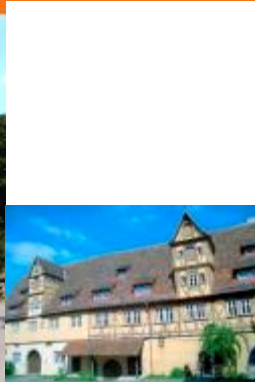
Rothenburg Youth Hostel - Spitalhof