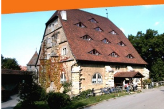
Rothenburg Youth Hostel – Roßmühle