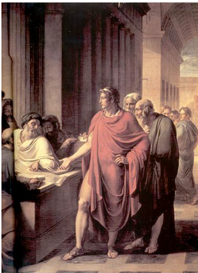
Fundación de la Biblioteca de Alejandría por Ptolomeo II, tal como la imaginó Vincenzo Camuccini en el siglo XIX.

El museo de Alejandría se fundó según el ejemplo del Liceo de Aristóteles, como una escuela del saber que combinaba la investigación y la conservación de la cultura griega. Por un lado, pues, estaban los sabios de diversas disciplinas, y, por otro, la gran Biblioteca, que servía a sus investigaciones y acogía a la vez la tradición científica, literaria y filosófica del legado clásico. Los Ptolomeos mantuvieron con generosidad