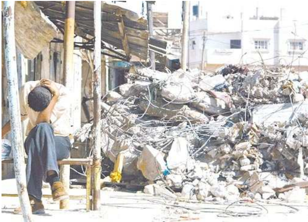
DESTRUCCIÓN. UN JOVEN PALESTINO SENTADO FRENTE A UNA CASA DEMOLIDA EN RAFAH