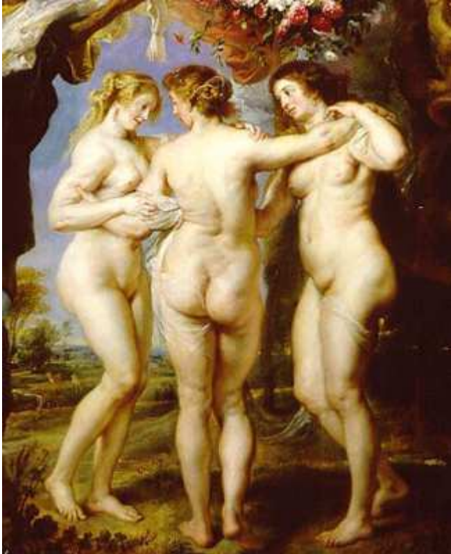
“Las tres gracias” de Rubens