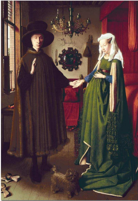
“Matrimonio Arnolfini” de Jan Van Eyck